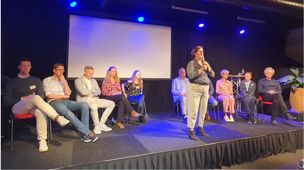
(slotdebat met de organisatoren en ervaringsdeskundigen)